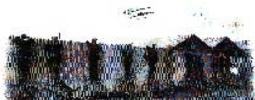
Parašiutų rengimo centras

Lapkričio 28 dieną, parašiutų rengimo centro karininkai lankėsi Ukmergės Užupio pagrindinėje mokykloje. Kariai buvo sužavėti vaikų ir mokytojų kūrybiškumu, ir pakvietė vaikus apsilankyti Pociūnų aerodrome, o mokytojas – pirmam šuoliui parašiotu. O paskui sulaukėm dovanos. O dovanas visada malonu gauti: