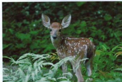
Naikinti ar branginti?

Mes su šeima pernai iškylavome prie Molėtų ežero. Malonu buvo ilsėtis. Skaidrus ežero vanduo, švarus miškas, įvairi augmenija. Daug uogų, krūmų, medžių. Matėme, kaip kiškiukai strykinėja, starnos suoliuoja, voverytės liuoksi. Miške daug stovyklautojų. Visi laimingi maudosi, renka uogas, grybus. Smagiai pailsėję grįžome namo.