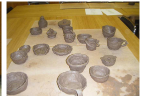
2012 metų birželio 7 dieną buvo organizuota

baigiamoji projekto išvyka į Dainavą. Vitos sodyboje mokiniai apžiūrėjo unikalį lauko keramikos degimo krosnį, gamino archainius valgius. Svarbiausias išvykos momentas – per metus pagamintų dirbinių išdegimas.